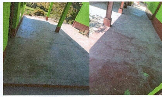
Foto 2: Piso en mal estado en los corredores de las aulas de preprimaria 1 y 2, segundo grado.